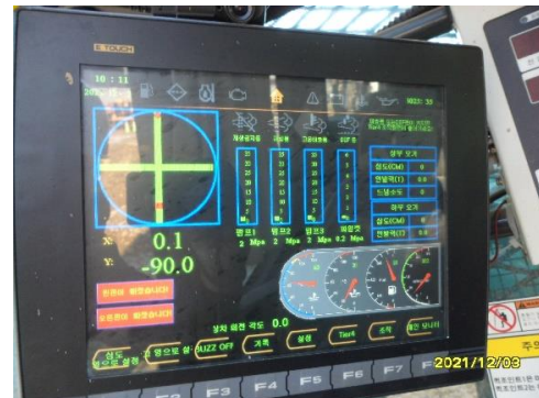
- 상,하부,해머,기복 와이어 점검 / 브레이크 패드점검 - 인디게이터 정상작동 점검 / 후방 카메라 정상작동 점검