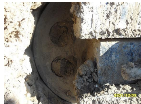
- 아웃트리거 실린더 누유점검 및 트랙 장력 / 아이들러 크랙 점검