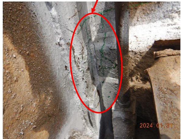
적재함 힌지 균열