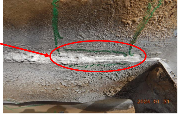
지지대 상부 용접부 균열